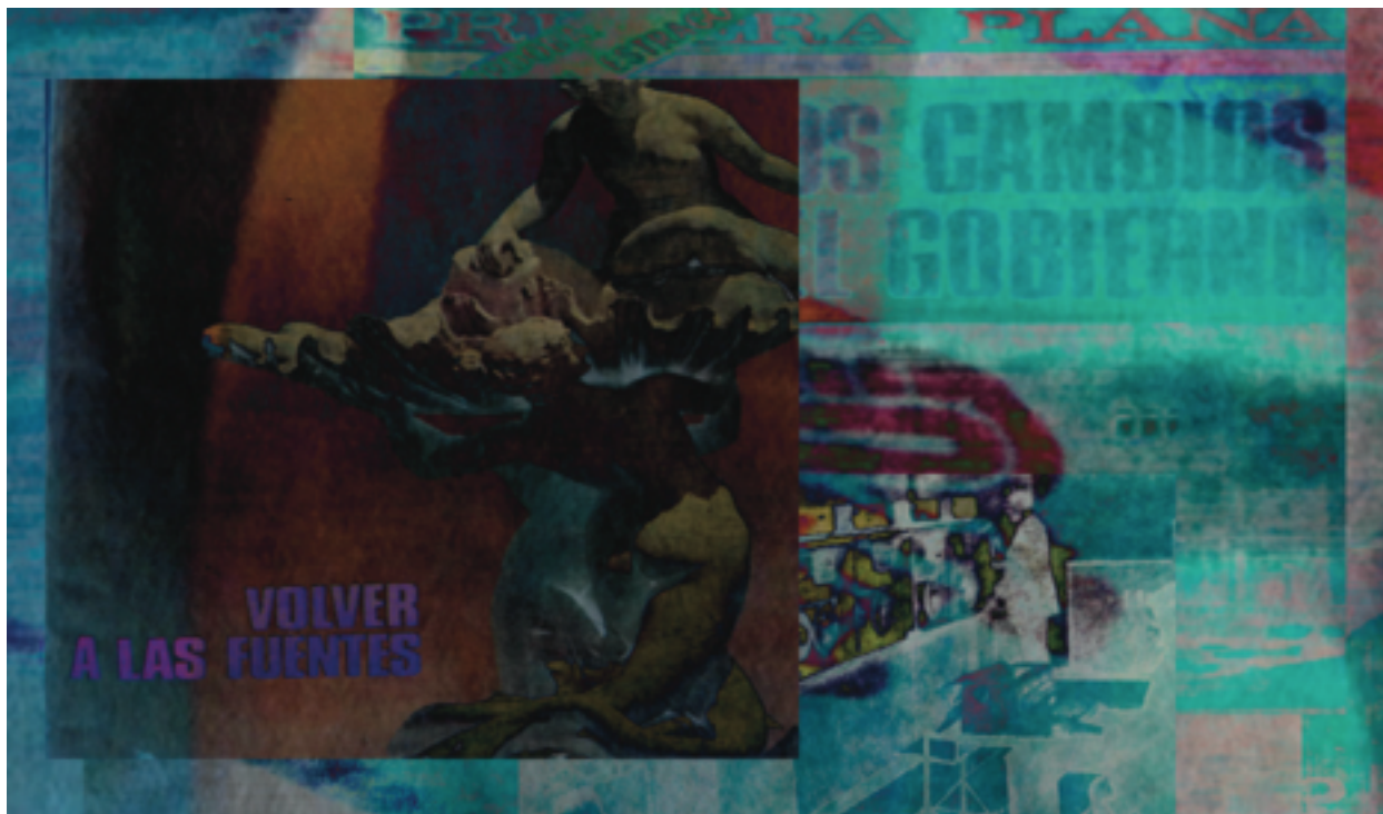
Figura 3: Um frame de um processo de construção de memória da aplicação Locí .

reconfigurando a rede de significados no seu nível textual e interferindo diretamente no que é “lembrado” pelo software, isto é, no que emerge como interface; o que por sua vez caracteriza o terceiro nível de operação, o perceptivo: imagens, textos e sons fragmentados, um contínuo devir de discontinuidades. Uma meta-forma.