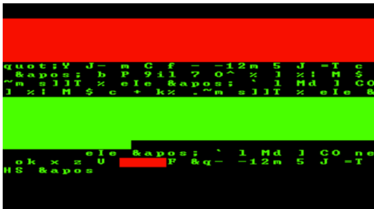
Figura 1: Um exemplo de visualização gerada pelo cliente original de Carnivore (2001), concebido pelo Radical Software Group .

No intento de explicitar as configurações das redes e protocolos – domínio em geral pertencente as suas organizações reguladoras ou profissionais especializados –, Alex Galloway desenvolveu, em conjunto com o coletivo de artistas Radical Software Group (RSG), uma aplicação online intitulada Carnivore (2001), que gera representações dos dados obtidos a partir de mensagens de texto e imagens - transformando-os em uma composição audiovisual exibida em qualquer browser . Carnivore analisa os chamados data packets , “moléculas” de informação transportadas pelos protocolos da rede. Estes pacotes são frequentemente monitorados por dispositivos de vigilância, como firewalls , para o controle de acesso e rastreamento do histórico de uso de um usuário da WWW.